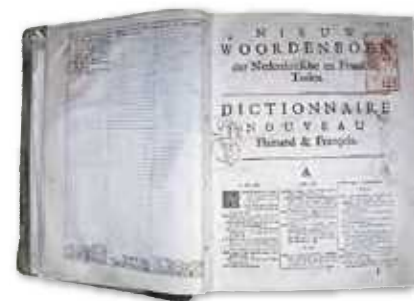
ハルマ『蘭仏辞典』第二版